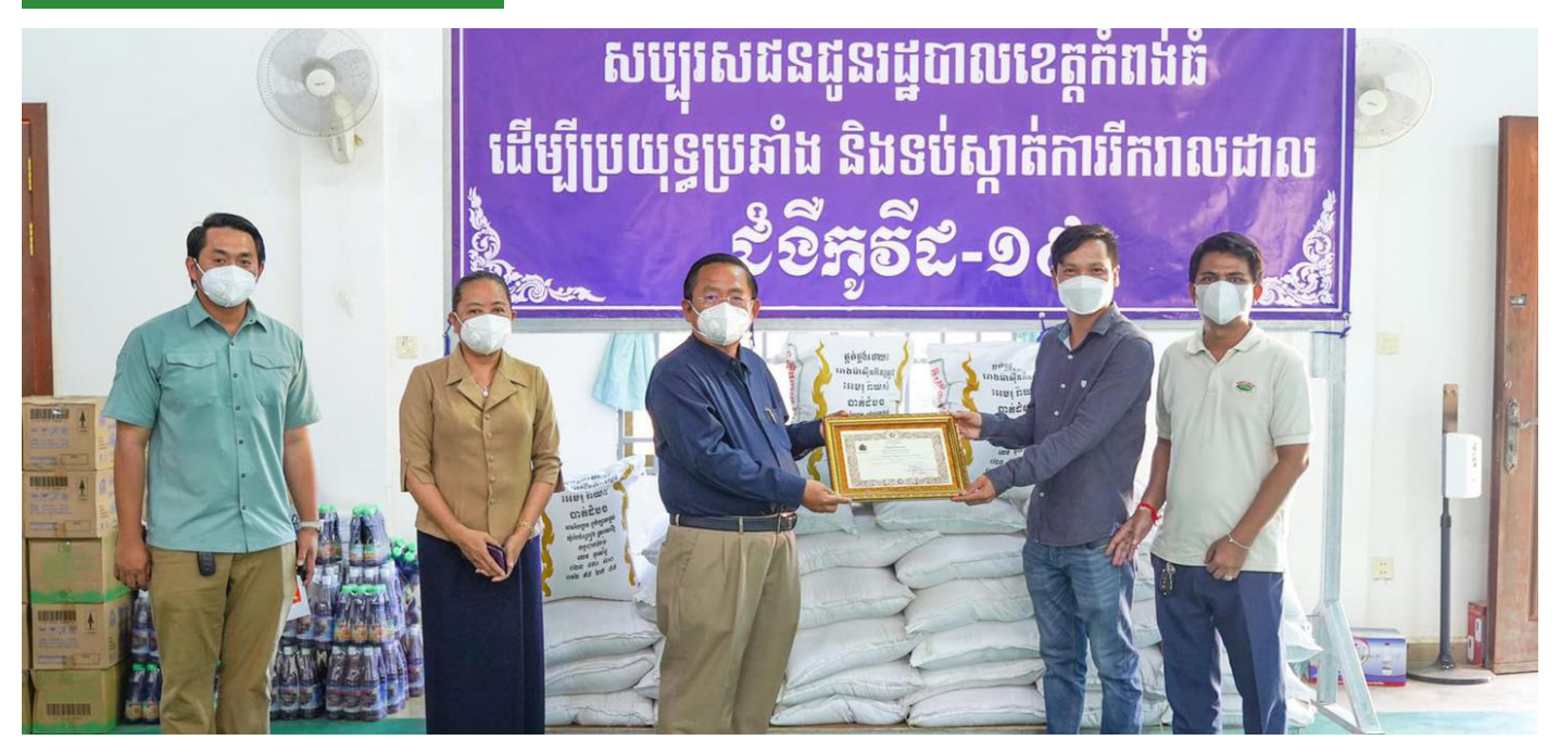
សមាព័ន្ធស្រុខអខ្ភះអង្គុខា ម្រងល់អំណោយអខ្ភះ៥តោន ថុនដល់រដ្ឋបាលខេង្កអំពខ់នំ ដើម្បីខែអខុនម្រខាខនដែលខេងារម៉ះពាល់ដោយអូទី៩១៩

CRF donates 5 tons of rice to Kampong Thom Provincial Administration to distribute to the poor people affected by COVID-19