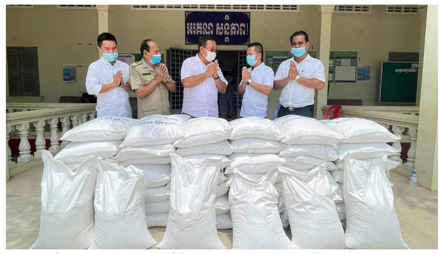
សមាព័ន្ធស្រុខអគ្គអាម្ពុជា ប្រគល់អំណោយ អគ្គដើតភាន ប្ខូនស់រដ្ឋបាលស្រុកថ្មគោល ដើម្បីចែកប្ខូនប្រខានដែលខ្វះខាត ដោយនិមគ្គិត្តនិង១៩